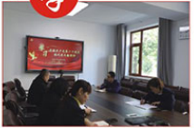
纪委会审计室党支部

要把认真学习领会党的二十大精神作为当前和今后一个时期的首要政治任务，坚定扛起监督专责机构使命担当，持续推动全面从严治党从严治党走向纵深，为推动大队高质量发展提供坚强保障。