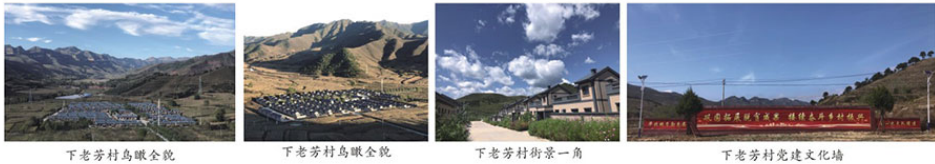
下老芳村鸟瞰全景

脱贫不是终点，而是新生活、新奋斗的起点。驻村工作队表示，巩固拓展脱贫攻坚成果是衔接乡村振兴的前提和基础，要持续抓紧抓好，让脱贫群众生活更上一层楼。一个组织振兴、产业兴旺、生态宜居、乡风文明、充满生机活力的全新下老芳村正在蓬勃向前发展。